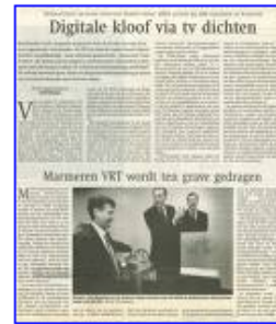
Digitale kloof via tv dichtten - De ... 1974 x 2199 - 2766 kB www.kandesign.com