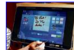
Digitale kloof tussen kinderen en ... 448 x 298 - 34 kB - jpg www.nrc.nl