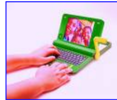
De oplossing voor de digitale kloof ... 400 x 325 - 42 kB - jpg alicelachtzicheenweblog.weblog.nl