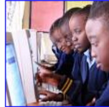
KPN verkleint digitale kloof 264 x 255 - 19 kB - jpg www.kpn.com