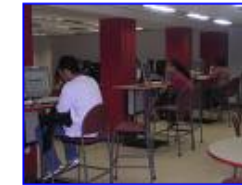
Digitale trapvelden 400 x 300 - 81 kB - gif www.cs.uu.nl