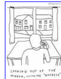
... digitale kloof , ... 391 x 497 - 14 kB - gif www.usabilitydesigner.be