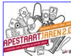
... gaming, de digitale kloof , ... 400 x 303 - 36 kB - gif www.graffiti-jeugdendienst.be