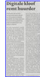
" Digitale kloof remt huurder", ... 572 x 1100 - 606 kB www.usp-mc.nl