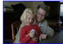
Neen aan de digitale kloof 257 x 171 - 9 kB - jpg www.kbs-frb.be