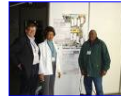
De Digitale Kloof 500 x 375 - 32 kB www.frieslandleernetwerk.nl [ Meer van www.frieslandleernetwerk.nl ]