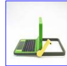
de digitale kloof 290 x 269 - 10 kB www.ond.vlaanderen.be [ Meer van www.ond.vlaanderen.be ]