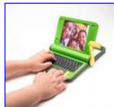
de digitale kloof 296 x 272 - 13 kB www.ond.vlaanderen.be