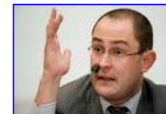
Gebruikte pc's om digitale kloof te ... 465 x 306 - 17 kB - jpg www.hln.be